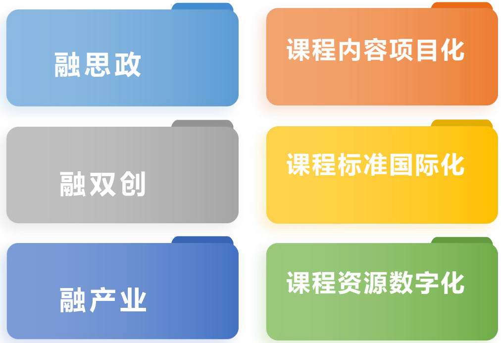
首批升本专业“一课三融三化”拟课程建设清单 (14门)